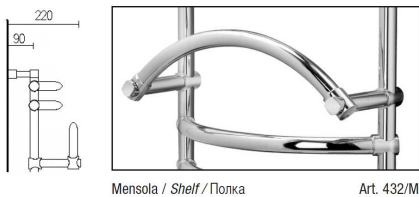
Mensola / Shelf / Полка

Pressione di esercizio massima 6 Bar Maximal working pressure 6 bar Максимальное рабочее давление - 6 бар.